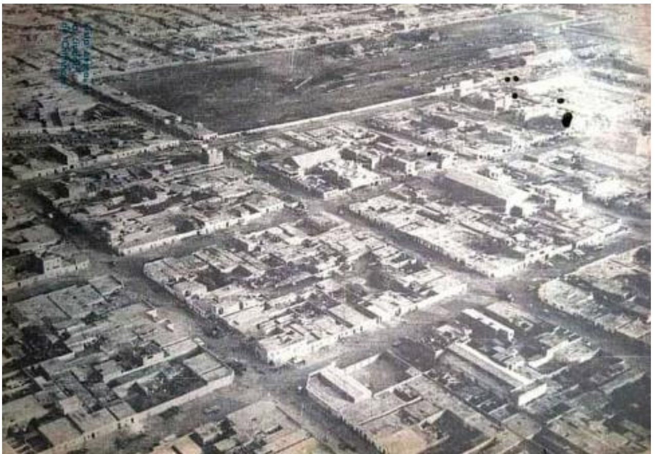
Figura 4: Foto aérea del centro urbano de la ciudad de Chimbote a mediados de los años 70, incluyendo en el lateral izquierdo a la ex estación del ferrocarril.

En Chimbote, la pérdida de su entorno histórico fue un problema que surgió debido al rápido crecimiento urbano y la falta de planificación que no sólo afectó la identidad y memoria colectiva de la comunidad chimbotana en el pasado, sino que también limitó las oportunidades de promoción del turismo cultural y el desarrollo sostenible de la localidad. Un claro ejemplo es “la antigua estación de ferrocarril de Chimbote”, una infraestructura ferroviaria construida entre 1870 y 1876 que formaba parte de la ruta Chimbote-Huallanca y que ha sido abandonada a pesar de haber sido declarada patrimonio histórico de la ciudad (Figura 4). Al igual que otros edificios culturales, éste ha tenido pocos notables intentos de rescate (Zavala, 2020).