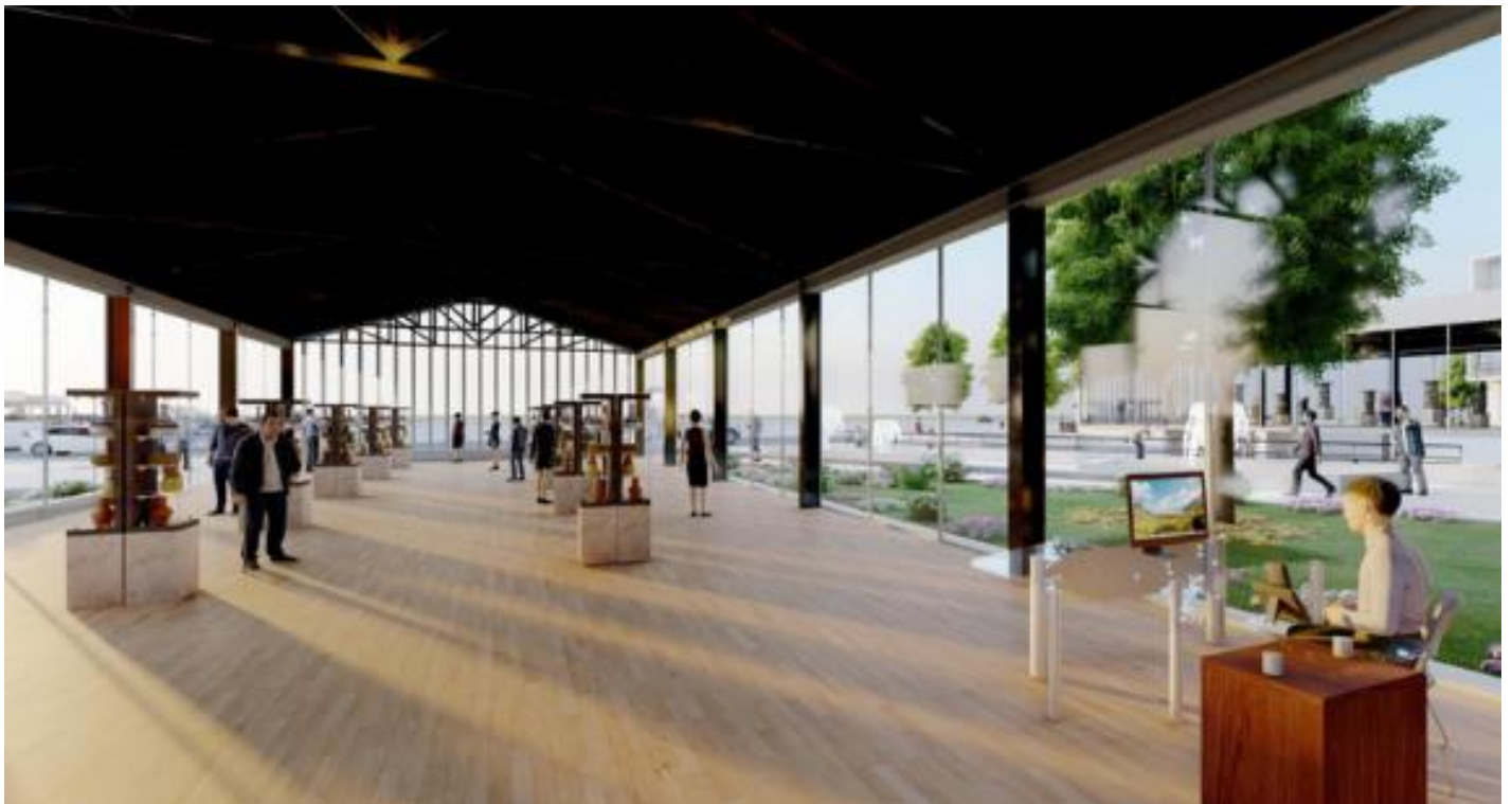
Figura 5: Vista interior del área de conservación cultural (Nave de la ex estación del Ferrocarril).

Por ello, se presentó un proyecto para convertir la Antigua Estación en un Centro Cultural de integración social dotándolo del valor histórico-arquitectónico que tiene. La propuesta de Juárez y Monzón (2021) conserva el trazo original sobre un lugar estratégico, cercano al Centro Monumental; posteriormente, bajo principios de reversibilidad, se restauraron las naves del antiguo ferrocarril y se implementó una sala de exposición abierta, añadiendo así valor al patrimonio y fomentando el interés de la población por la historia de Chimbote (Figura 5).