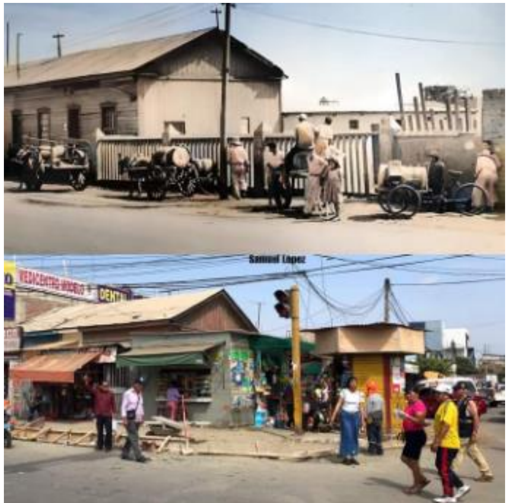
Figura 1: Antigua casona frente a la Ex Estación del Ferrocarril junto con aguateros de la ciudad 1940-1952 y foto actual de la casona.