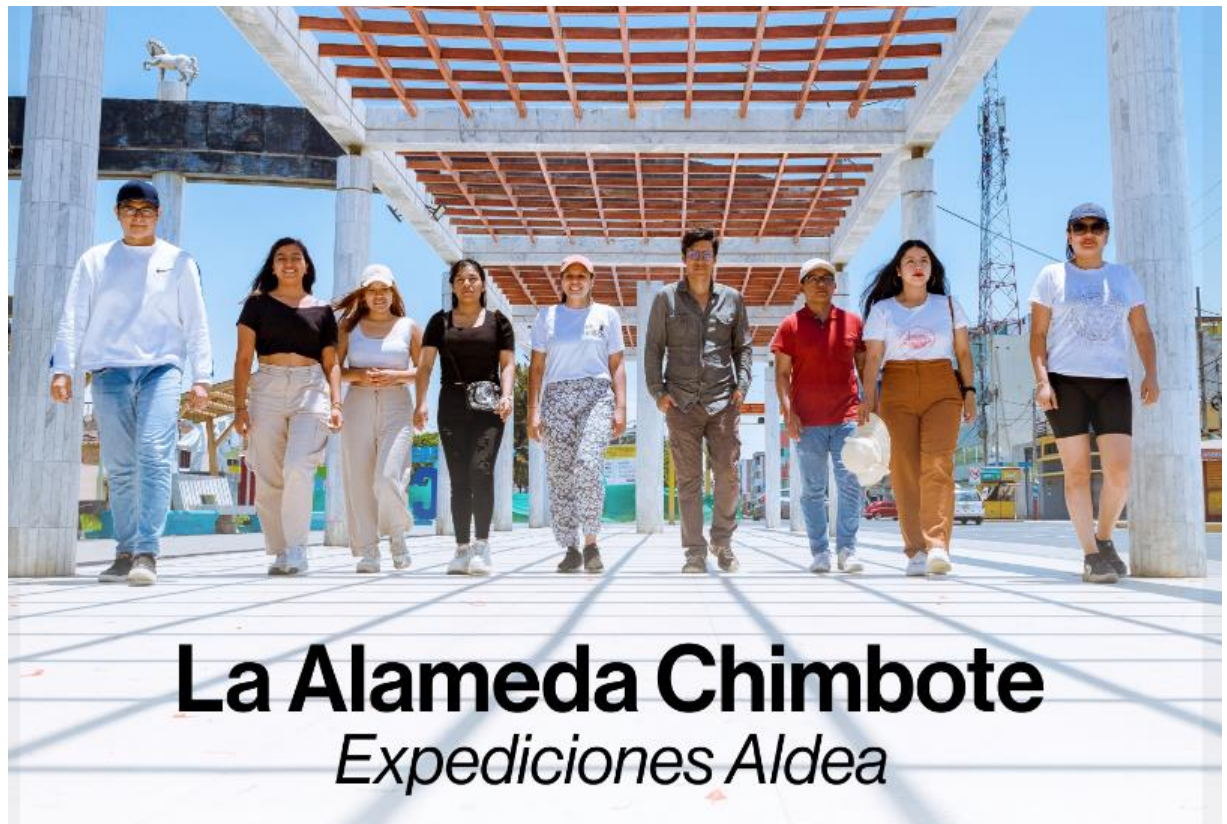
Figura 3: Equipo de Aldea.

Se obtuvo apoyo de organizaciones culturales como “ALDEA Arquitectura Cultural” quien, desde hace unos años, es la encargada de promover la recuperación del patrimonio cultural emblemático chimbotano. Su objetivo se basa en la concientización de los habitantes hacia su legado cultural lo que conlleva a la rehabilitación de espacios que complementan los atractivos culturales y turísticos de la ciudad. El trabajo en conjunto permitió crear nodos de convivencia pacífica y sostenible con una identidad más auténtica y significativa (Figura 3).