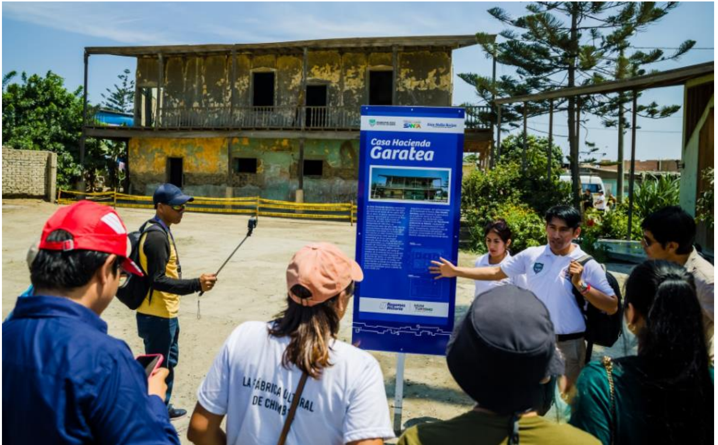
Figura 8: Foto del equipo Aldea en campañas de concientización a la preservación del patrimonio cultural en el distrito de Santa, Ancash, Perú.

El apoyo que se tiene a la fecha es muy importante, sin embargo, no tiene la suficiente difusión entre los pobladores de Chimbote, puesto que, al conversar con ellos, desconocían estas actividades. ALDEA ha iniciado la publicación y difusión de la cultura chimbotana a través de la web con el fin de llegar a un público más amplio, joven y entusiasta.