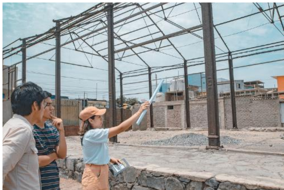
Figura 2: Estructura metálica de lo que fue la segunda estación de ferrocarril en Chimbote.

Para ello, se emplearon fichas de observación durante las visitas de campo con el objetivo de recopilar datos empíricos y observaciones directas relacionadas con el estudio. Asimismo, se realizaron entrevistas estructuradas a personajes claves y se llevó a cabo un registro fotográfico y detallado de las observaciones realizadas en el terreno. Estas visitas de campo proporcionaron información valiosa para complementar y respaldar el análisis teórico del estudio (Figura 2).