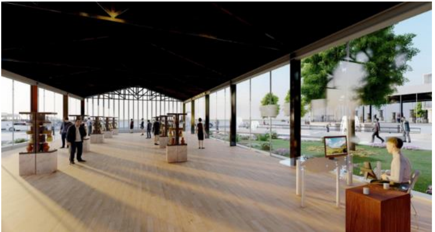
Figura 5: Vista interior del área de conservación cultural (Nave de la ex estación del Ferrocarril). Fuente: "Centro Cultural de Integración Social y puesta en valor de las naves de la ex estación del Ferrocarril en la ciudad de Chimbote 2021" (Tesis para obtener el título profesional de arquitecto)