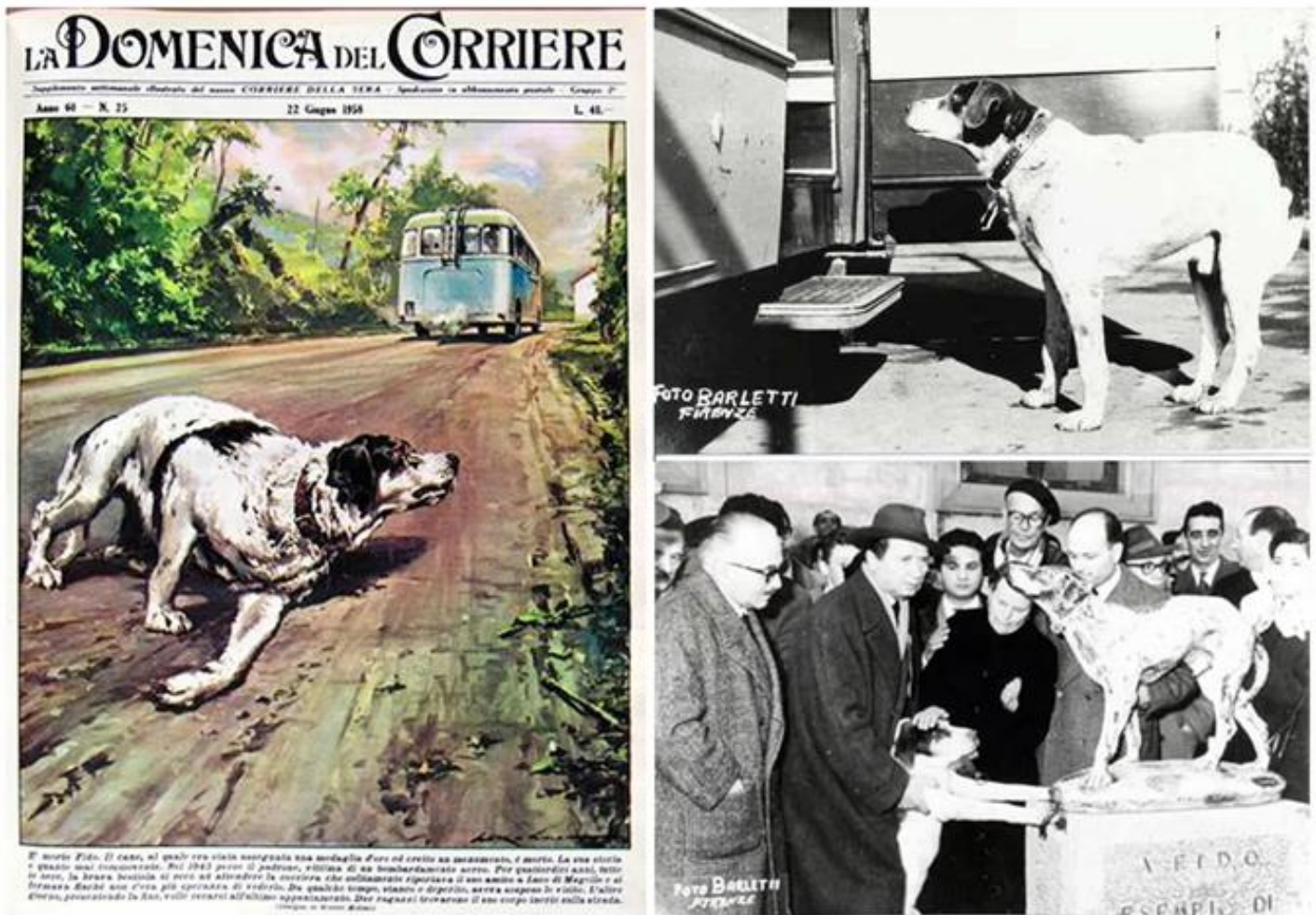
Figura 1. Monumento a Fido, Borgo San Lorenzo, Italia.

Por ejemplo, la historia de Fido (Borgo San Lorenzo, Italia) un perro Pointer Ingles, que fue adoptado por Carlo Soriani en el año de 1941. Soriani fallece en un bombardeo en 1943 (Figura 1). Durante 14 años, su fiel mascota asistió cerca de 5.000 veces a la parada de autobús, esperando pacientemente el regreso de su amo. La historia conmovió a la comunidad, y el año 1957, el alcalde Giuseppe Graziani le encargó al escultor Salvatore Cipolla una obra homenaje: una estatua en mayólica con base de piedra ubicada en la Piazza Dante (Firenze Post, 2021). Al ser vandalizada, la estatua original fue reemplazada por otra en bronce, que permanece en la actualidad visible.