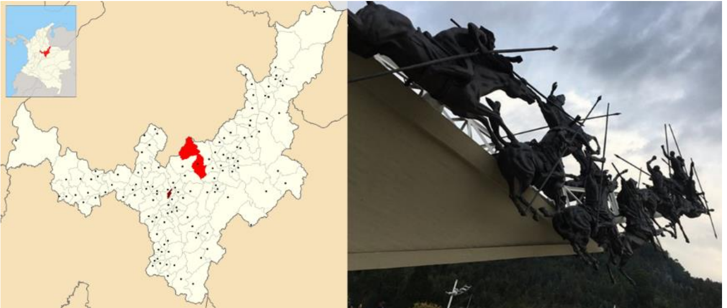
Figura 4. Localización Paipa (Colombia). Monumento a los Lanceros del Pantano de Vargas.