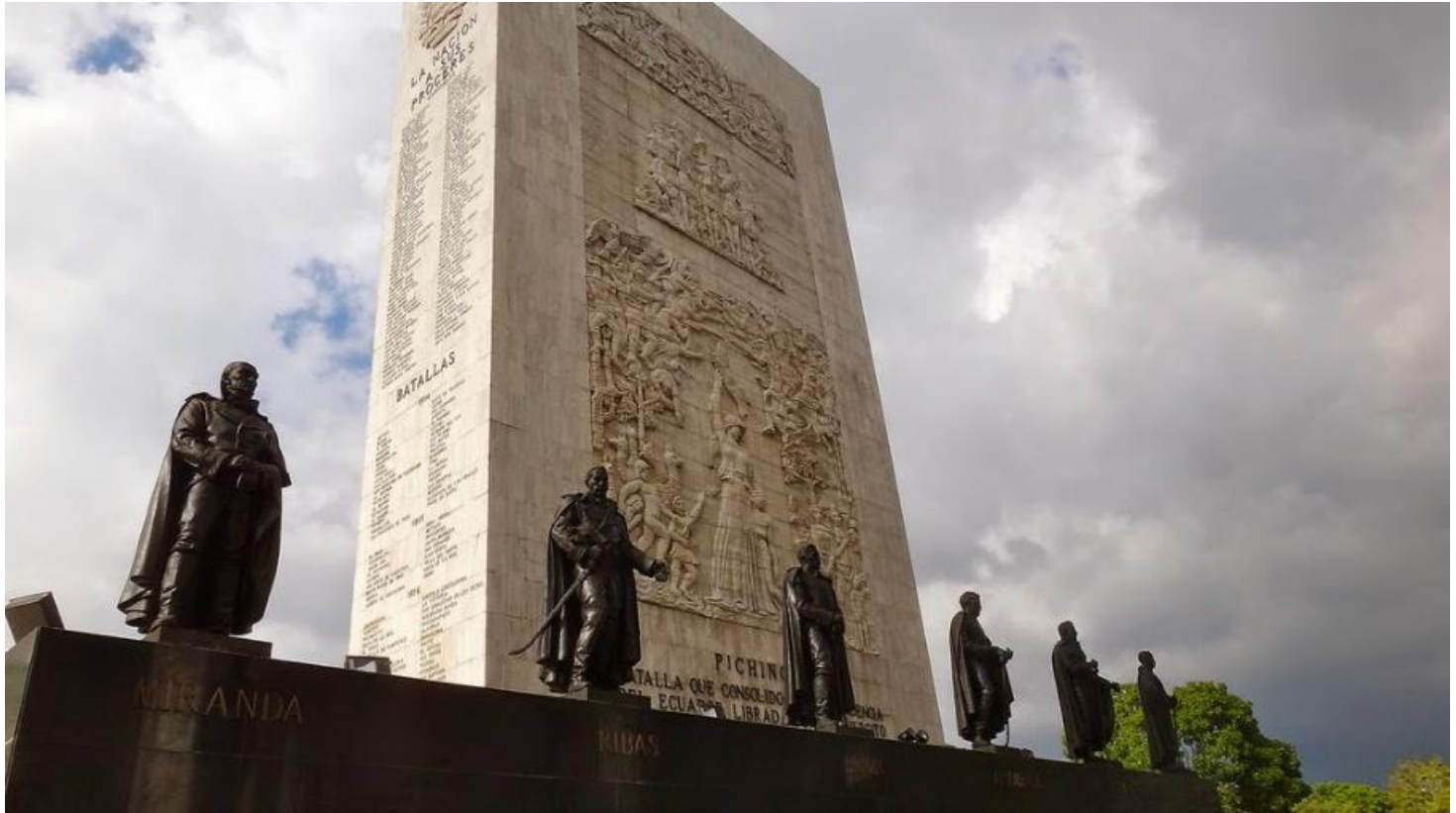
Figura 2. Monumento de la Nación a sus Próceres, Venezuela.

En el caso de América Latina, los monumentos fueron establecidos durante el siglo XIX, con base a los procesos de descolonización territorial. Estos monumentos fueron estructuras importantes en la configuración de las identidades, que legitimaron las historias nacionales y a los héroes fundacionales. Este fenómeno también se dio en Venezuela, donde surgieron monumentos a figuras como Simón Bolívar, Antonio José de Sucre, Francisco de Miranda que hace parte del Monumento de la Nación a sus Próceres (Figura 2), convirtiéndose en símbolos cívicos que buscaron la liberación de la población bajo las colonias europeas (Ruiz Villoslada, 2008).